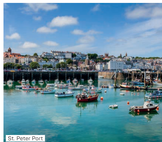
St. Peter Port