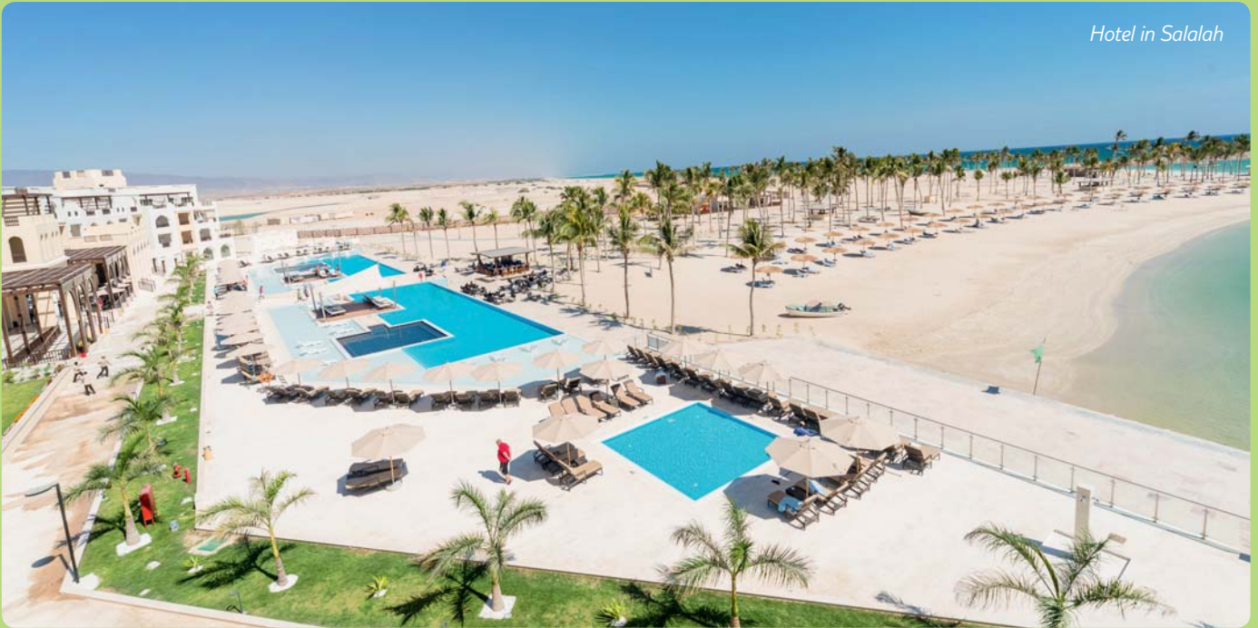
Hotel in Salalah

schönsten Souqs in Arabien. Neben Gold- und Silberwaren und vor allem auch Weihrauch und Gewürzen, findet man im Muttrah Souq Textilien, Schuhe uvm.